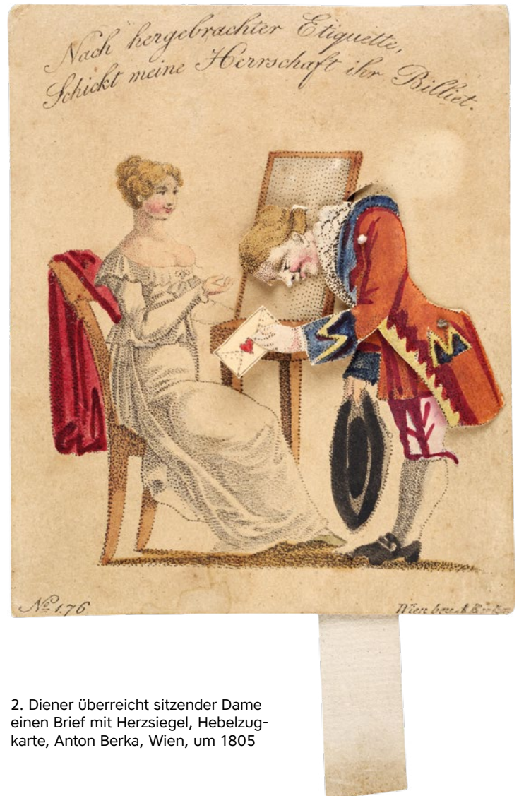
2. Diener überreicht sitzender Dame einen Brief mit Herzsiegel, Hebelzugkarte, Anton Berka, Wien, um 1805