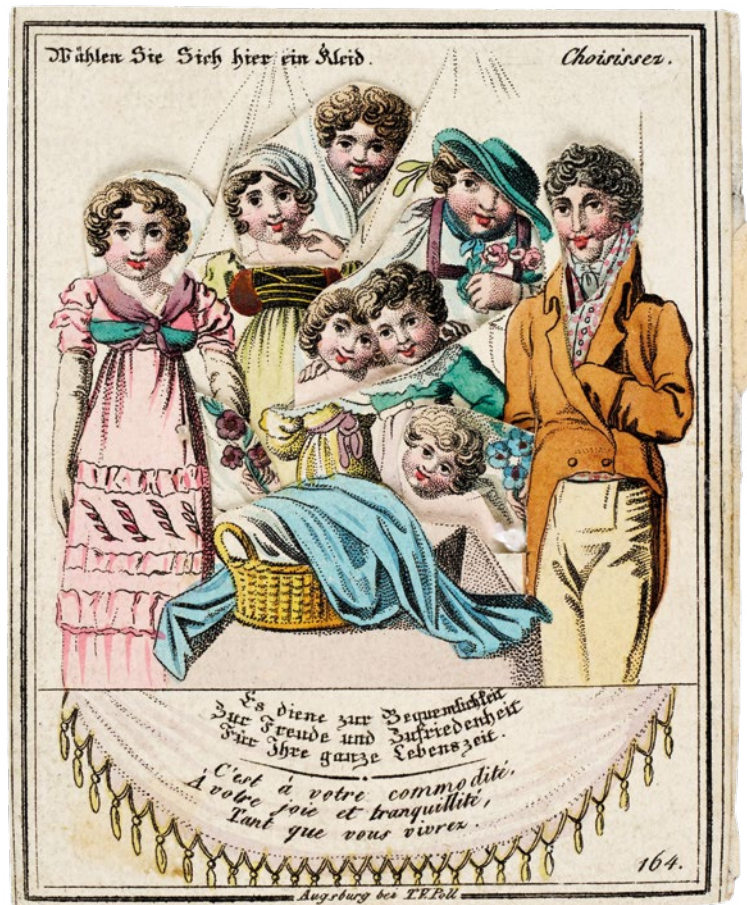
1. Damen- und Herrengarderobe, Hebelzugkarte, T. V. Poll, Augsburg, um 1815, mit Darstellung der Mechanik im Karteninneren.